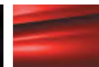
Красный Adén (в производстве с 07.2014)