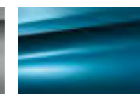
Синий Belle Ile (M)