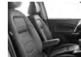
Кожа Claudia 1