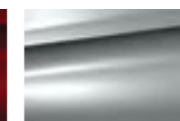
Серый Aluminium (M)