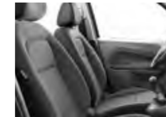
Ткань C&T Jill 1