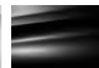
Черный Perla Nera (M)