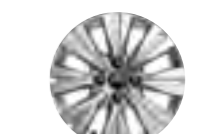
Литые диски 16" Blade