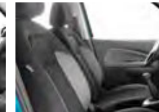
Ткань C&T Mixou 1