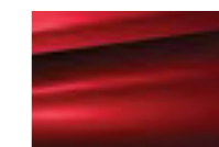
Красный Rubis (M)