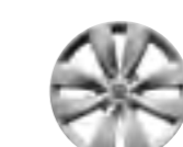
Колпаки 15" Astérodéa