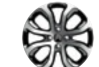
Литые диски 17" Clover