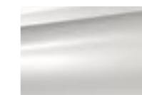
Белый Nacré (N)