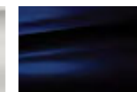
Синий Encre (M)