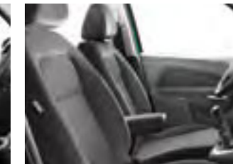
Ткань C&T Brise 1