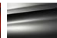
Серый Shark (M)